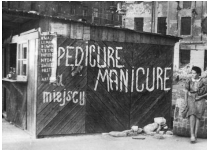
Zofia Chomętowska, Plac trzech krzyży, 1945 „Kronikarki”

W „Kronikarkach” oczywiście nie brakuje zdjęć, które można odczytać jako oskarżycielskie, ale jest tam także życie w ruinach, są portrety samych fotografek, widać spojrzenie czysto estetyczne, poszukujące szczególnej kompozycji czy zderzenia form. Są także skrupulatne podpisy opracowane przez Grzegorza Piątka, nie tylko lokalizujące obiekty w przestrzeni, ale też – w czasie; sygnalizujące, co było w tym miejscu przed wojną, co zostało, a co nie zostało odbudowane itd. Te działania pozwalają zobaczyć nie „ruiny” (martwe), lecz „miasto” (żywe), nie symbol, lecz, zgodnie z tytułem albumu, kronikę.